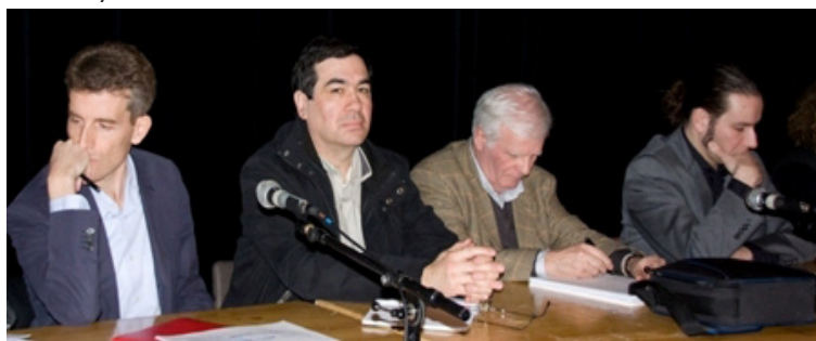
Fosses, le 4 Février 2009

SaDur a également été convié à plusieurs réunions avec les élus, notamment les maires et responsables des communautés d'agglomérations ou de communes, et avec la SNCF.