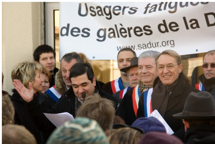
Louvres, le 31 Janvier 2009

SaDur ne pouvait pas rester les bras croisés. Aussi nous avons agi de deux façons différentes :